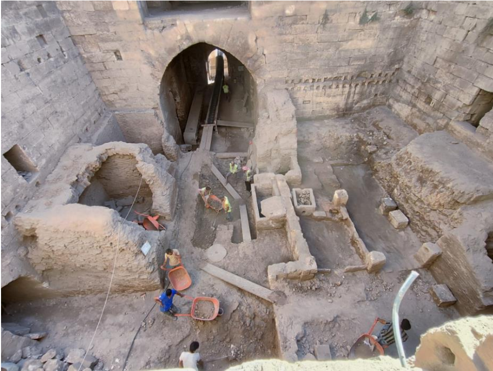
Fotoğraf : Harran Kale/Saray'daki kazı çalışmalarından görünüm. 26 Ağustos 2023