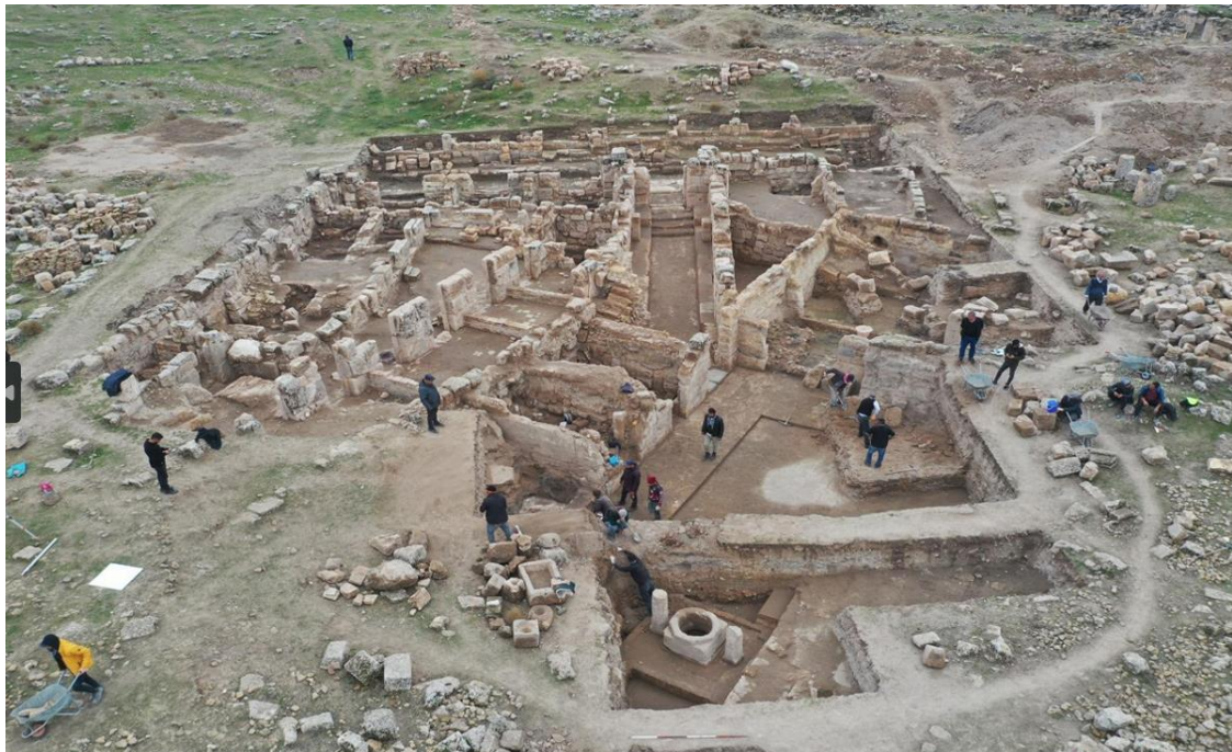
Medrese kazısından görünüm 2022

2023 yılında da Medrese'de kazı çalışmaları yapılarak Medrese'nin baş eyvanı ve batı eğitim mekanı meydana çıkarıldı. 2024 yılında da çalışmaların devam etmesi planlanmıştır.