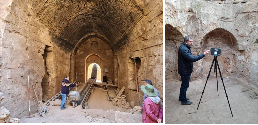
Harran Kalesi'ndeki çalışmaların görünümü.