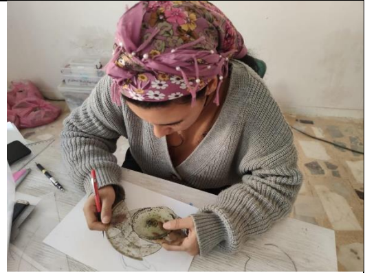
Çam objenin çizimi yapılırken. Kazı Evi 2022