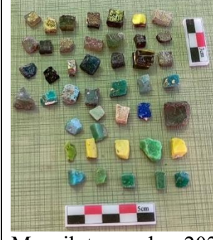
Mozaik tesseraları 2023