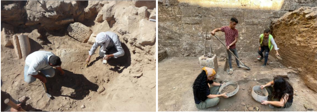
Kazı çalışmalarından görünüm. Harran.

Bakanlığı, Atatürk Kültür, Dil ve Tarih Yüksek Kurumu, Türk Tarih Kurumu ve tarafımızca 2021 yılında imzalanan protokol gereğince “Harran Ören Yeri Kazıları’nın Yıl Boyu Desteklenmesi projesi” kapsamında Harran Ören Yeri’nde her yıl Harran Üniversitesi ev sahipliğinde kazı ekibimizce kazı, restorasyon ve konservasyon çalışmaları yapılmaktadır.