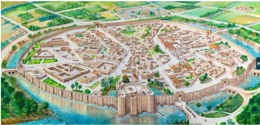
Harran Antik Kenti canlandırması MS 8-13. yüzyıl (Abdurahman Birden)

Şehir surları ve savunma hendeği, görkemli İçkale, Ulu Cami, Çarşı Hamamı, Doğu Çarşısı, Şadırvanlı Avlu, Kale Hamamı, Hayat el-Harrani Türbesi, Yakup'un Kuyusu, konik kubbeli evler Harran'da ziyaretçilerin görebildikleri eserlerin bazılarıdır. Toprağın altındaki Sin Tapınağı, medreseler, saraylar, anıtsal ve sivil mimari yapılar, yollar, çeşmeler gibi birçok kültür varlığı ise halen gün ışığına çıkmayı beklemektedir.