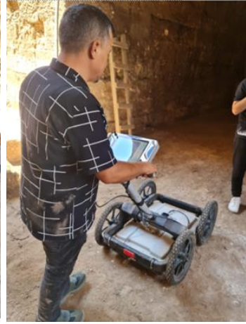
Jeoradar çalışması, Harran Kalesi.