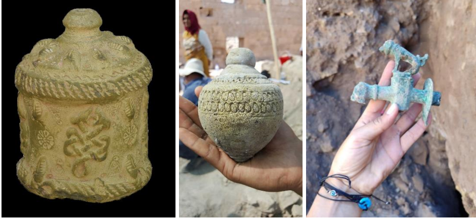
Harran kazısı buluntularından bazıları; ilaç şişesi, kürevi konik kap ve musluk.

Höyük’de de kazı çalışmaları yapıldı. Höyük’ün üstünde kuzeybatı yönünde yapılan çalışmalarda üst tabakalarda Zengi ve Eyyubiler Dönemi’ne ait evler, çömlekler, sikkeler vb., alt tabakalar da ise Tunç Çağı’na ait kerpiç duvarlar, figürinler ve çömlek parçaları bulundu. Höyük’ün doğusunda yapılan çalışmalarda ise üst tabakalarda Demir Çağı’na ait Ay Tanrısı Sin Tapınağı’na adanan çivi yazılı tuğlalara, alt tabakalarda da Tunç Çağı’na ait kerpiç duvarlı mekânlara, kadın ve çocuk iskeletine, pişmiş toprak figürinlere, Kalkolitik damga mühürlerine, seramik parçalarına vb. rastlanıldı.