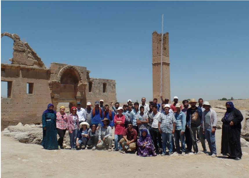
Harran Arkeolojik Kazı Ekibi 2015