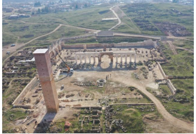
Restorasyon ve Kazı Sonrası, Harran Ulu Cami Ocak 2024