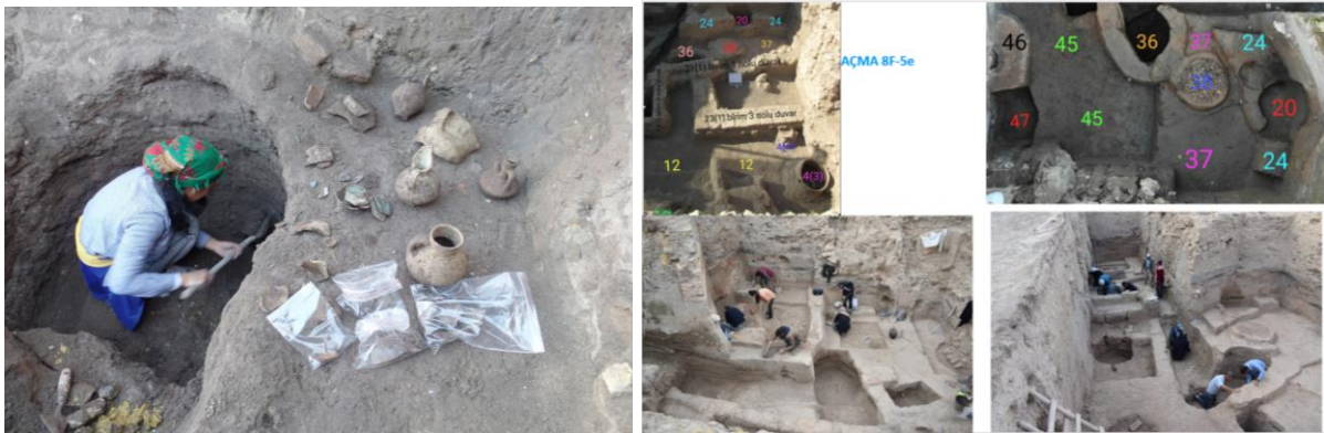
Höyük kazı çalışmasından görünüm.