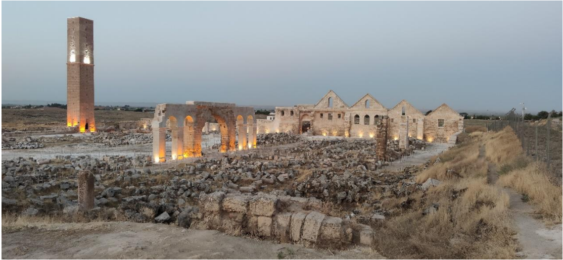
Işıklandırılan Harran Ulu Camii’nin batıdan görünümü 2022/ Harran