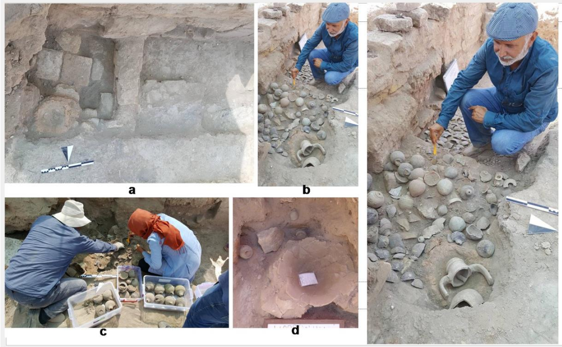
Miskçi Dükkanı kazı çalışmaları. Harran 2016.