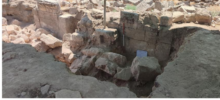
Kilise kalıntısından görünüm. 2023

Kilisenin kuzeyinde yapılan kazı çalışmasında, 3. nefe ait kemer ayakları sütun başlığı hizasında meydana çıkarıldı. Çalışmalarda kemer ve tonozlardan düşen cam tesseralar ele geçmiştir.