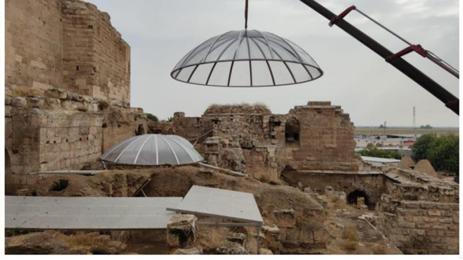
Koruma çalışmaları. Saray Hamamı. Harran