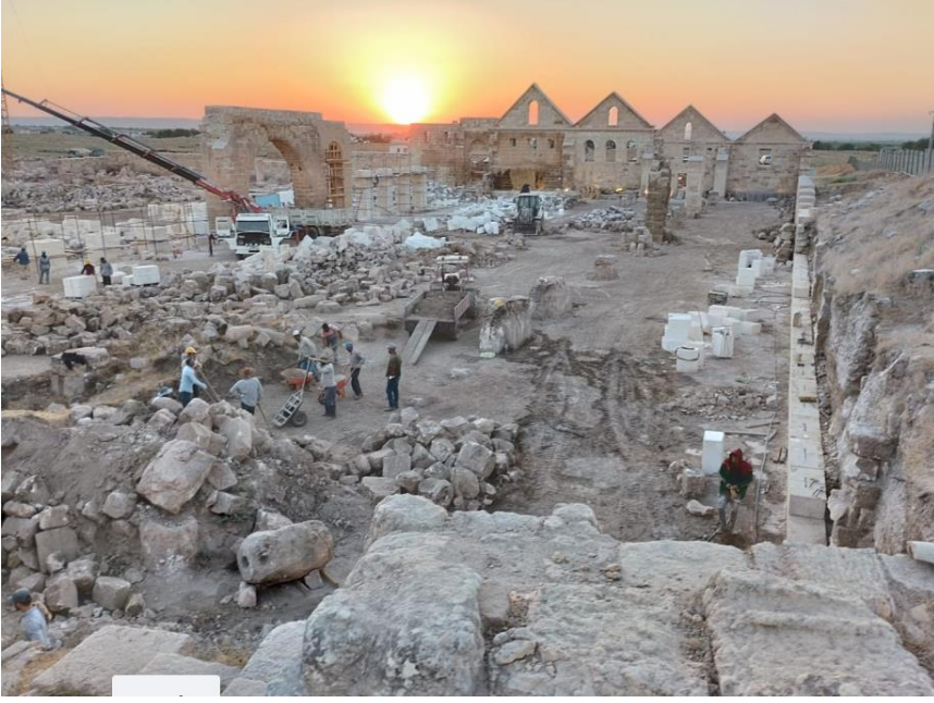
Harran Ulu Cami'de yapılan çalışmaların görünümü. Ağustos 2023