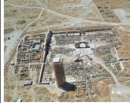
Restorasyon ve Kazı Öncesi, Harran Ulu Cami Mart 2023