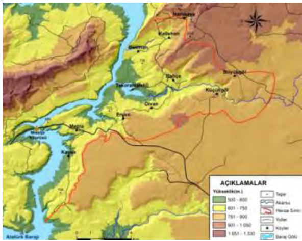
▲ Harita 2: Takoran Vadisi Ve Yakın Çevresinin Fiziki Haritası

Takoran Vadisi sadece coğrafi güzellikleri ile değil aynı