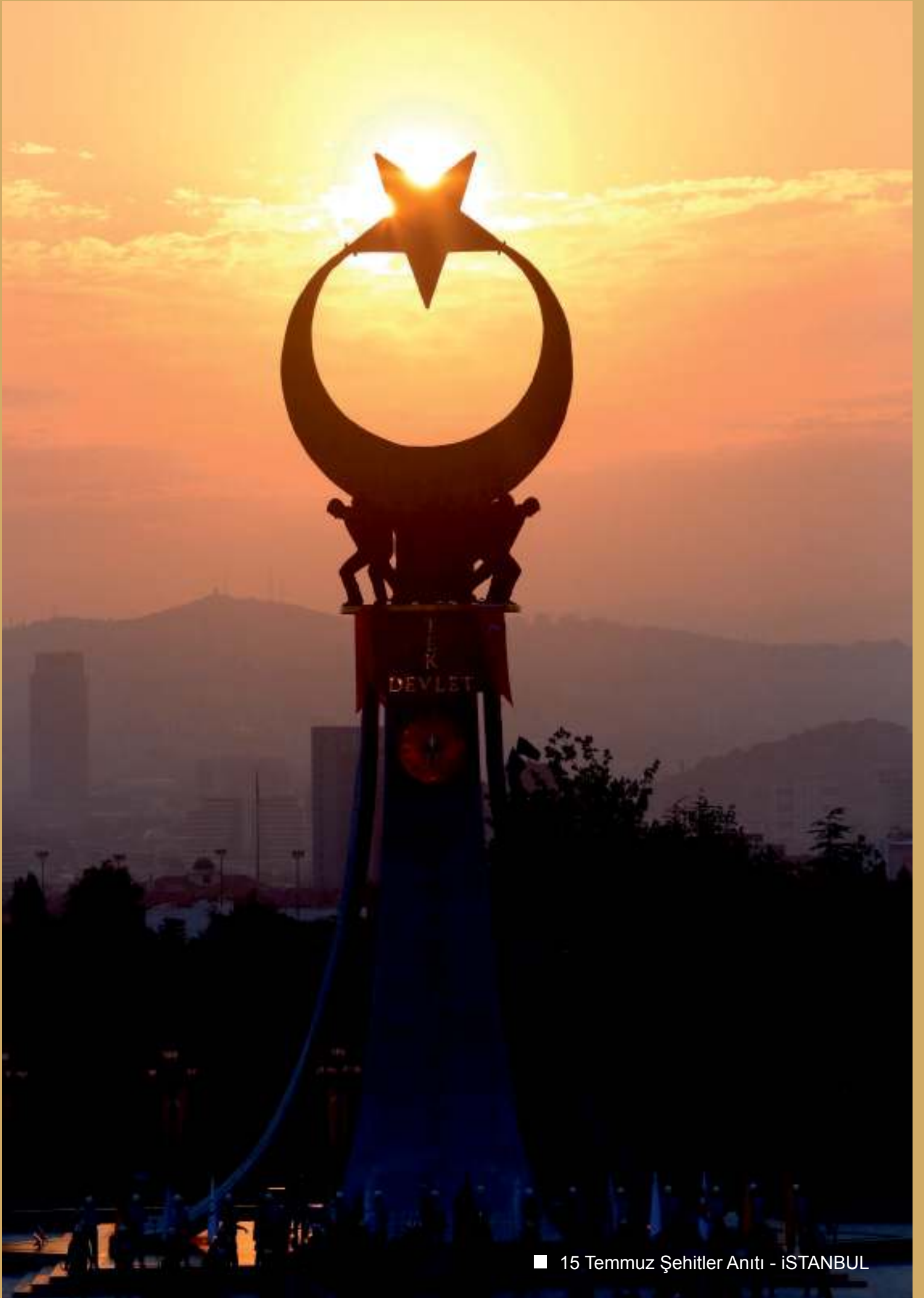
■ 15 Temmuz Şehitler Anıtı - İSTANBUL