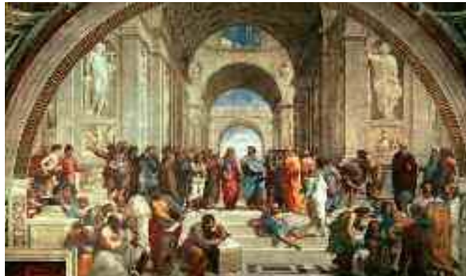
Av. Ahmet Nazlı Darbeler Anayasalar ve Toplumsal Sözleşme