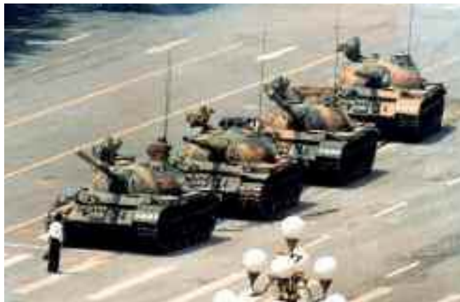
A. Levent Ertekin Farklı Pencereden 15 Temmuz